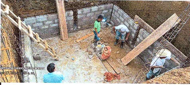
Foto1: MANTENIMIENTO DE FOSA